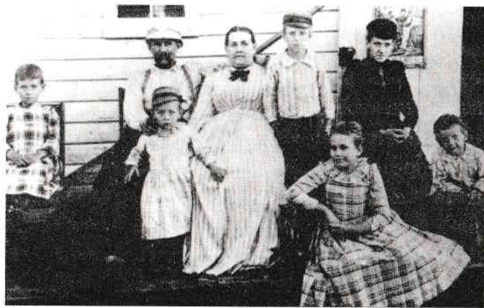
Familia lui Nikola Tesla la casa lor din Smiljan.

dit faima. Era un om foarte erudit, un adevărat filosof al științelor naturii, poet și scriitor, iar despre predicile sale se spunea că sunt la fel de elocvente ca cele ale lui Abraham a Sancta Clara 1 . Avea o memorie prodigioasă și adesea recita fragmente lungi din opere în diverse limbi străine. Spunea de multe ori, în glumă, că, dacă operele unor clasici s-ar pierde, el ar putea să le reproducă din memorie. Stilul lui de a scrie era foarte admirat. Formula propoziții scurte și concise și era plin de umor și de ironie. Remarcile umoristice pe care le făcea erau întotdeauna deosebite și pline de însemnătate. Ca să vă faceți o idee, am să vă spun câteva.